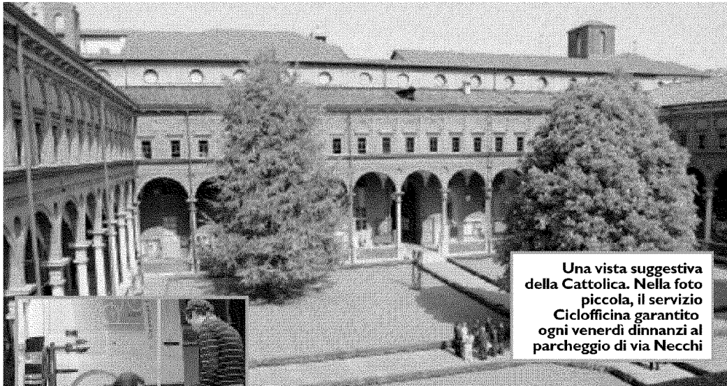
Una vista suggestiva della Cattolica. Nella foto piccola, il servizio Ciclofficina garantito ogni venerdì dinnanzi al parcheggio di via Necchi

a 210 euro, il prezzo dell'abbonamento annuale è di 170 euro. Il progetto ha visto la luce lo scorso novembre e al momento sono ancora pochi i ragazzi che vi hanno aderito, appena sessanta, ma il numero è destinato a crescere. I pagamenti possono essere fatti solo con carta di credito e accedendo alla propria pagina on line I-Catt, ma il modello è già compilato e nel giro di pochi giorni si ritira il proprio abbonamento. L'attenzione che si dedica allo studente e ai suoi spostamenti è un modo per rendere forse più facile, sicuramente meno stressante, lo studio. Non è un caso infatti che servizi come Ciclofficina abbiano entusiasmato i ragazzi, che possono in questo modo effettuare piccole e grandi riparazioni per le loro due ruote. Il furgoncino sosta dinnanzi alla Cattolica, precisamente nel parcheggio di via Necchi 9, ogni venerdì dalle ore 10 alle 17,30.