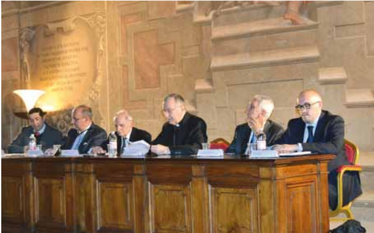
Palazzo della Cancelleria, Sala Vasari - Roma