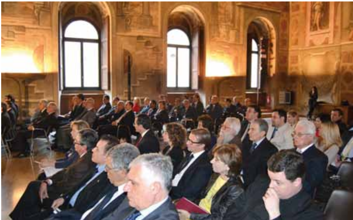
Palazzo della Cancelleria, Sala Vasari - Roma