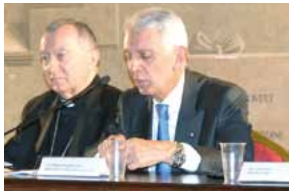
Card. Parolin, Francesco Maria Greco Ambasciatore d'Italia presso Santa Sede

Abbiamo di fronte un compito impegnativo. L'Esposizione Universale non è e non deve essere solo un'occasione per erigere monumenti che vengano ricordati per la maestosità e la bellezza delle proprie architetture. Deve invece proporsi come terreno di dialogo sulle grandi sfide del presente e dell'avvenire: lo sfruttamento indiscriminato del suolo e dell'acqua, l'apparente paradosso della compresenza di malnutrizione e ipernutrizione e la necessità di ridurre, se non azzerare, gli sprechi.